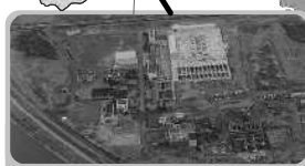
岡東浄化センター