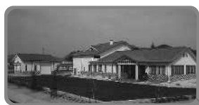
建部浄化センター