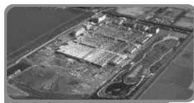
児島湖浄化センター（岡山県管理）