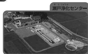
瀬戸浄化センター