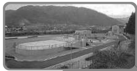
御津中央浄化センター