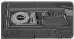
足守浄化センター