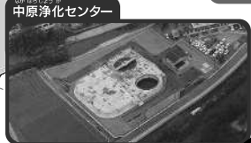
中原浄化センター