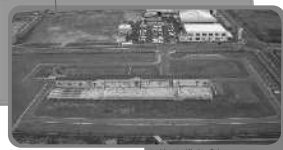
吉井川浄化センター