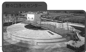
野々口浄化センター