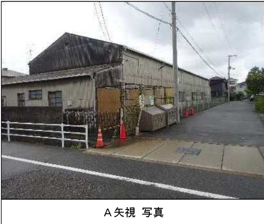
A 矢視 写真