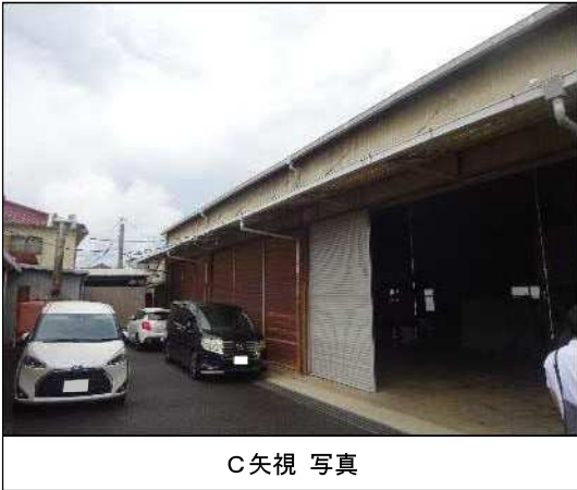
C 矢視 写真