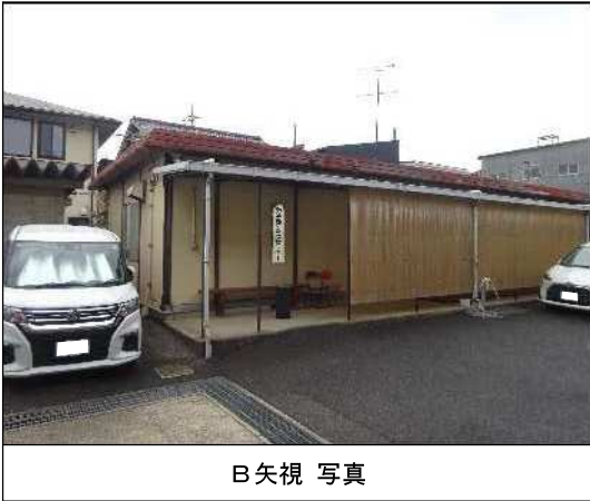
B 矢視 写真