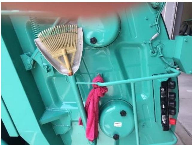
⑪ 操作盤ガード 左