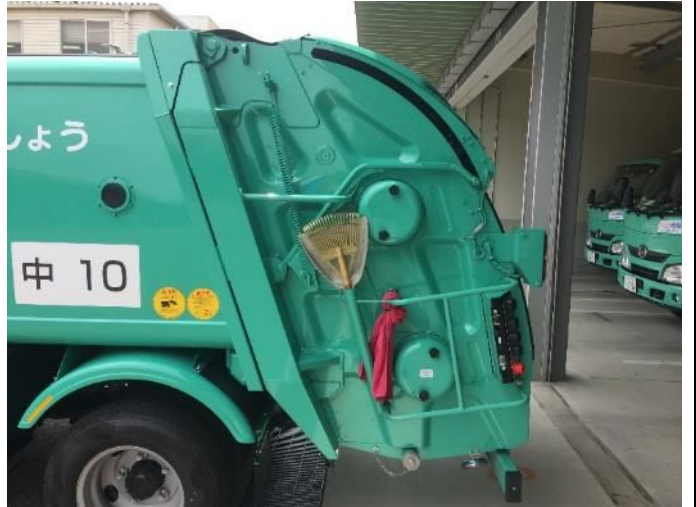
⑧ 消火用ガラス窓 左側面後部