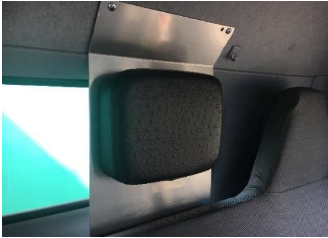
① 中央席ヘッドレスト