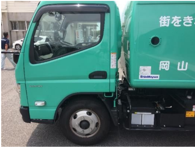
⑦ 消火用ガラス窓 左側面前部