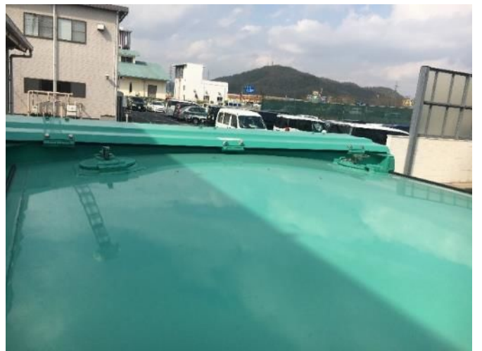
⑩ 天井注水口 2か所