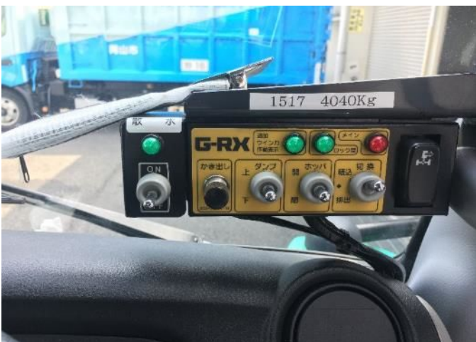
⑤ PTO スイッチ