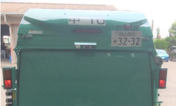
㉑ バックカメラ、マイクホン