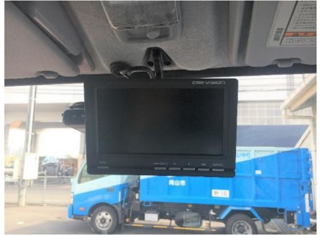
⑳ バックカメラ モニター