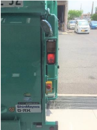
⑮R 後右サイド付近 1ヶ取り付け