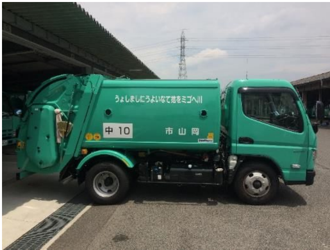
⑨ 消火用ガラス窓 右側面前後部