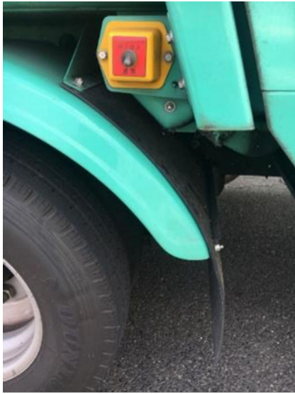
⑱ R タイヤフェンダー泥除け