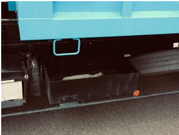
⑬ 左側ほうき入れ箱