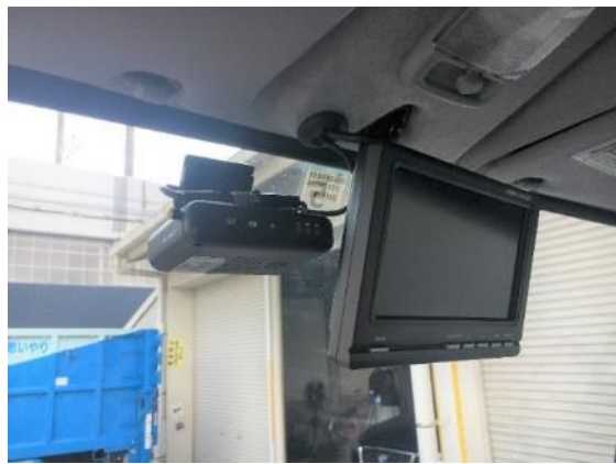
④ ドライブレコーダー、バックモニター