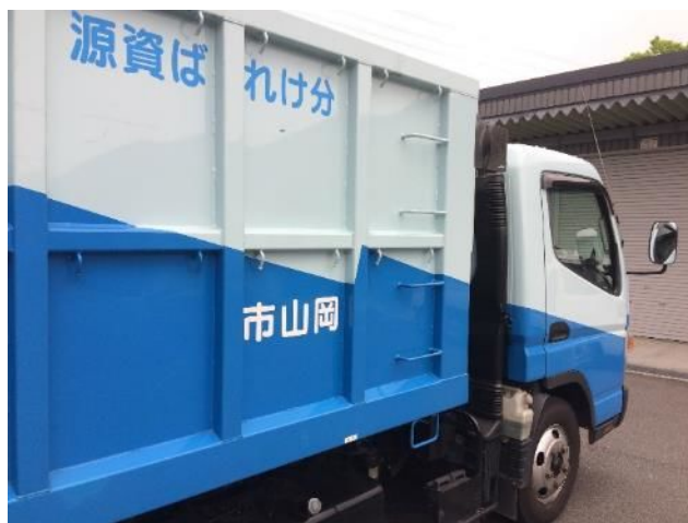
⑯前部乗降ステップ