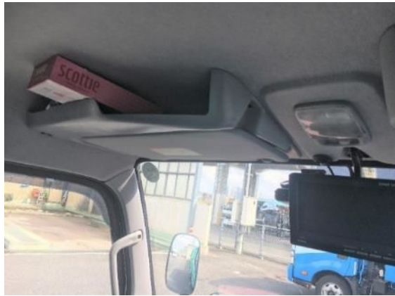
② 収納 BOX