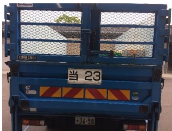
⑥ 車番プレート台座、観音扉