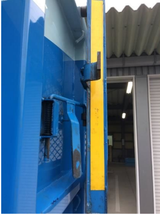
⑨ 観音扉側面ロック