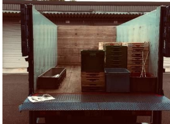
⑫ ボデーサイド左右小物入れ、タイヤ止め